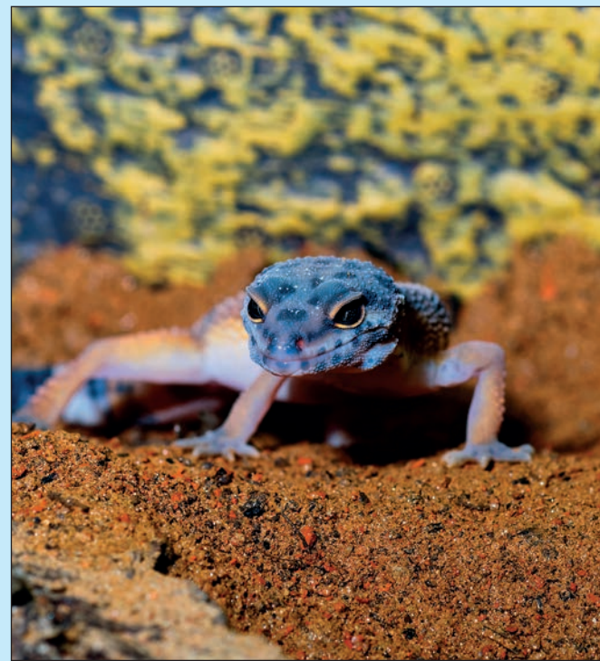
☐ Krása akvariálních ryb a terarijních živočichů. Vlevo Apistogramma cacatuoides – cichlidka papouščí, vpravo Gekončík noční (Eublepharis macularius).

rybek, kterým dominuje skoro 30 cm velká kreveta. Jsou zde k vidění i velmi zajímavé rybky německých akvaristů a cichlidy z jezera Tanganika z odchoven polských