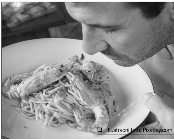
Ilustrační foto: Pixabay.com

Jedná se o velký piknik se spoustou dobrého jídla nejen od regionálních výrobců. Nebude chybět ani hudební doprovod. Vstupné je 50 korun, děti do 15 let zdarma. (voř)