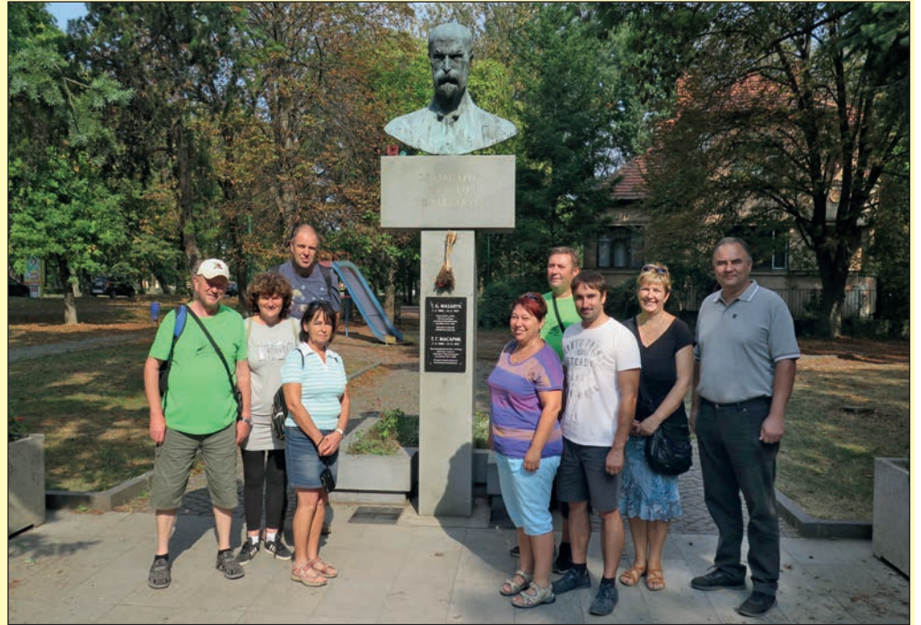
□ Výprava z podhůří Orlických hor se vyfotila i před pomníkem prvního československého prezidenta Tomáše Garrigue Masaryka.